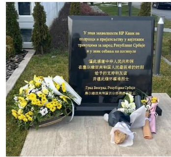
塞尔维亚贝尔格莱德