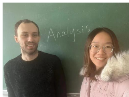
抽象代数和分析课程