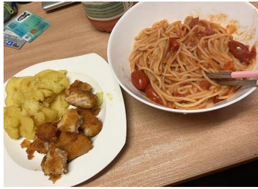
过年包的饺子和首次尝试意大利面

在我住的宿舍居民区，也有很多特色的美食，我也发现了一家波兰人开的东南亚人主厨的中餐厅，我想这是一种美食的融合，也是文化的融合吧。