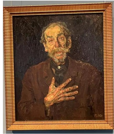
艺术馆——文化同情主题

除了在学校的专业课程中，我取得了几乎满绩点的成绩，我也利用这一段自己住的时间完成了很多其他学习内容，我学了 GRE，并在雅思考试中获得了很好的成绩，尤其是在不断和国外朋友们交流的过程中，我的口语能力得到了很大的提升，备考的过程很艰难，但是每次望向窗外，我都觉得人生值得。