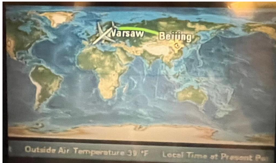
坐上去往波兰华沙的航班