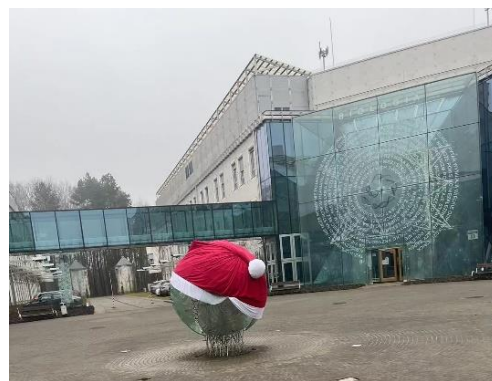
比亚韦斯托克大学教学楼

其实出发前并不是一帆风顺的，当时国内外疫情形势严峻，护照和签证办理都需要很多的手续，整个过程持续了大概五个月。全国多地都在抗击疫情，大部分航班的起飞时间一直变动，但我不想放弃这次学习交流的机会，当时只有一个想法：以后可能会有很多次出国学习或者旅行的机会，但那时的心境却和 20 岁的我完全不同了。我准备了很多防疫物品，消毒酒精、医用口罩等等，幸运的是，在出发的一周前，北京和大连都已经解除封控，我也顺利登上了去往波兰的航班。回想起当时自己毅然决然出发的勇气，尽管周围有很多不支持的声音，但坚持做